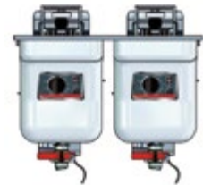
Basic + Einbau 622