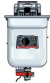
Basic + Einbau 311