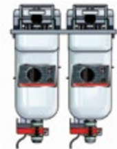
Basic + Einbau 422