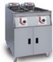
Super Easy 622