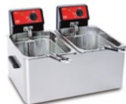
Eco 6 + 6