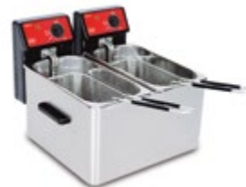
Eco 4 + 4