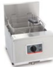
Profi + 8