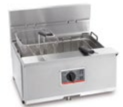
Profi + 10