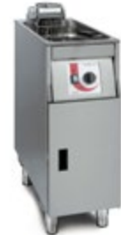
Super Easy 311