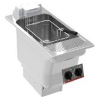
Super Easy 311/M