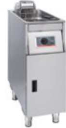
Basic + 311