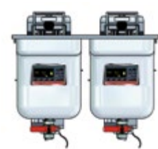
Vision Einbau 622