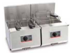
Profi + 8 + 8