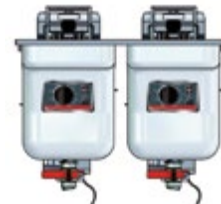
Basic + Einbau 622