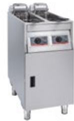
Basic + 422