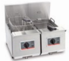
Profi + 6 + 6