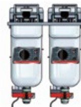
Basic + Einbau 422