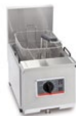
Profi + 6