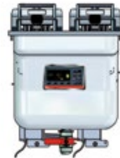
Vision Einbau 411/412