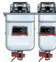
Vision Einbau 522