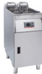
Basic + 411