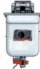
Basic + Einbau 311