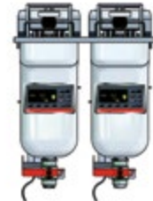
Vision Einbau 422