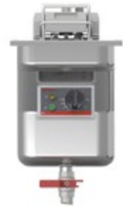
Super Easy Einbau 311