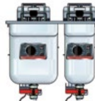
Basic + Einbau 522