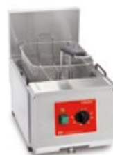
Frita + 6