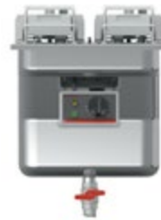
Super Easy Einbau 411