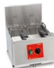
Frita + 8