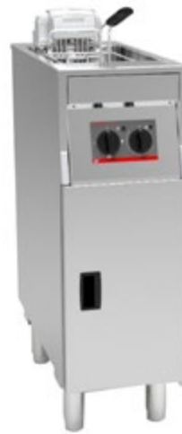
Super Easy 311