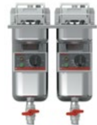
Super Easy Einbau 422