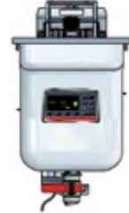
Vision Einbau 311