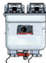
Basic + Einbau 411