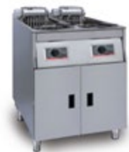
Basic + 622